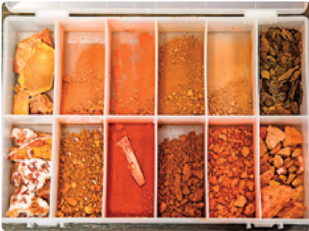
Aus Steinmehlen und Vulkanerde stellen wir unsere Farben her.

Erdfarben selber herstellen – ein sinnliches Erlebnis