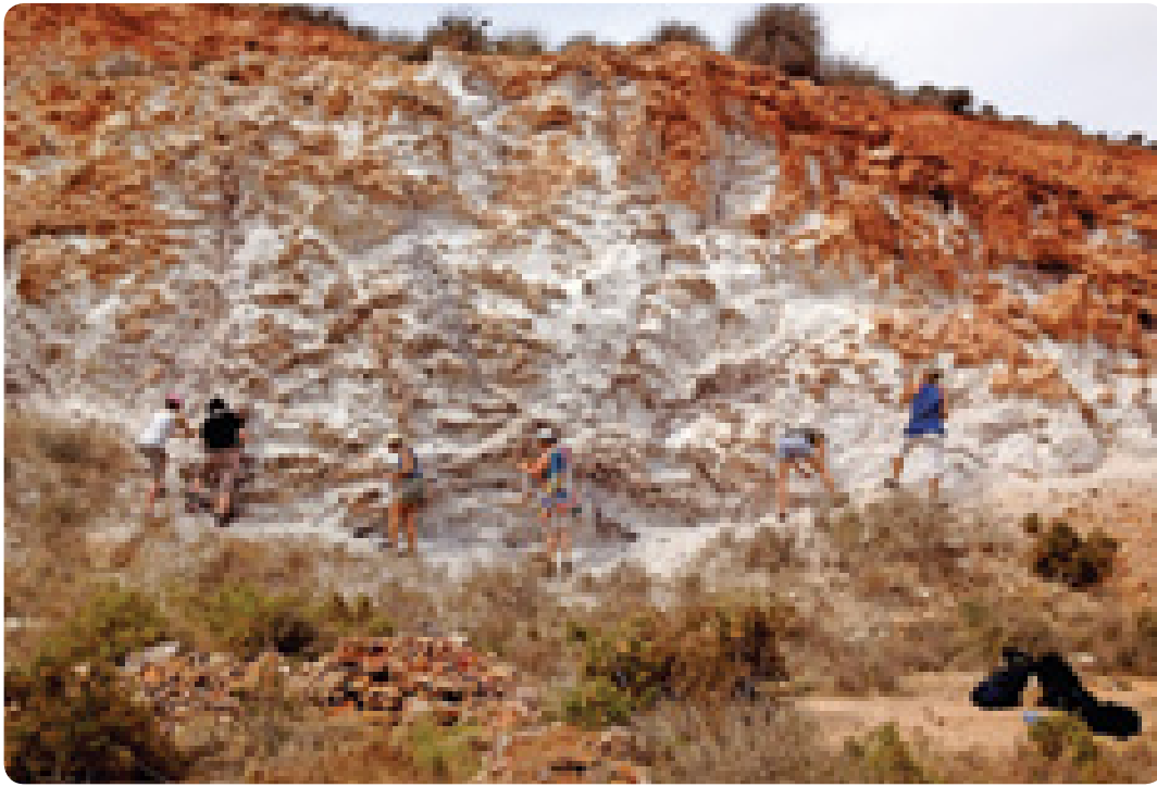
Andalusien - Cabo de Gata.

Eine Malreise zum Naturpark «Cabo de Gata»